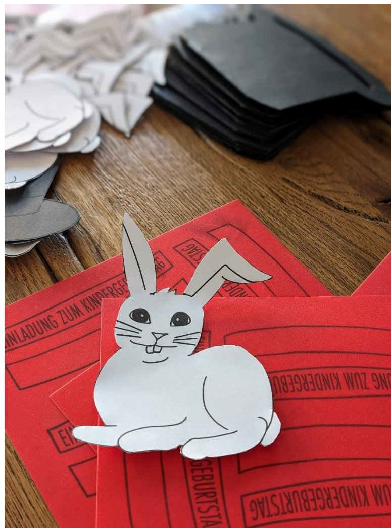
Bild 2: Schneide die Vorlagen für Zylinder, Hase und Karte aus farbigem Tonpapier aus!

Insbesondere beim Hutband – je nach Papierstärke auch beim Hasen – kann man auch gut in Massenproduktion gehen und mehrere Papiere zum Schneiden übereinanderlegen.